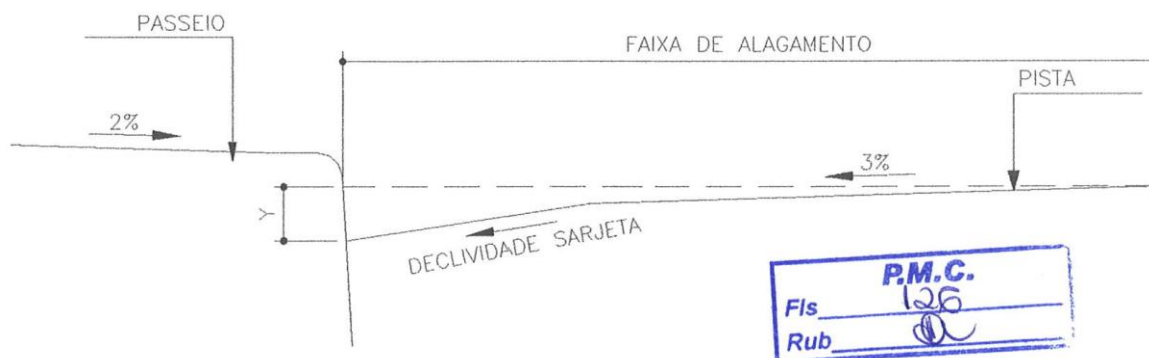
Figura da seção típico da via

Para o projeto de sarjetas do Município de Cláudia MT foi adotado o limite de 3,50 m