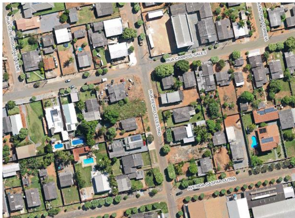
Figura 06 - Centro Cívico