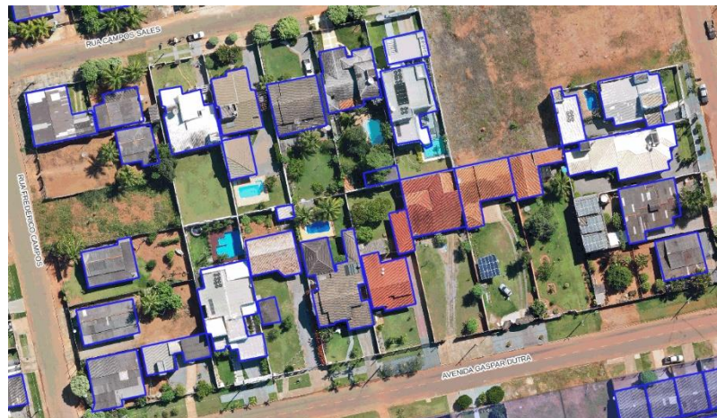
Figura 03 - Bairro Rotary

Abaixo detalhamos o padrão construtivo atual de alguns bairros do perímetro urbano de Cláudia-MT.