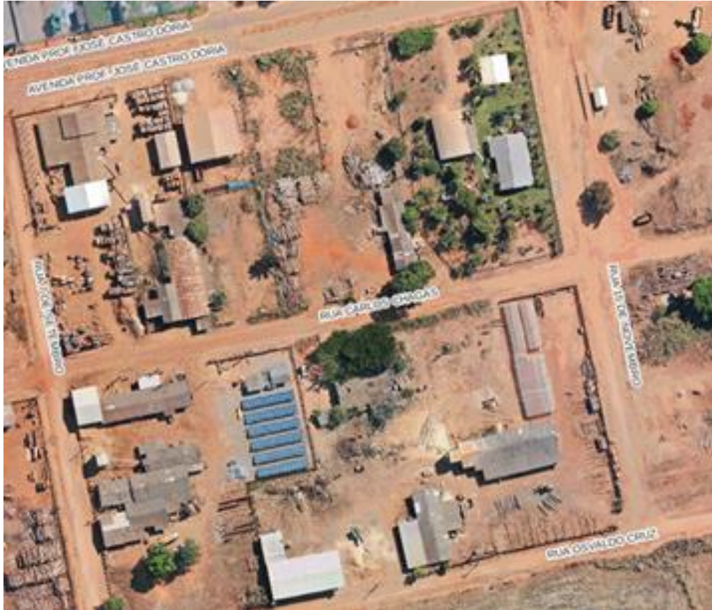
Figura 07 - Industrial

Cnpj: 01.310.499/0001-04 - Email: gabinete@claudia.mt.gov.br Av. Gaspar Dutra, s/n - Cep: 78540-000 - Fone: (0xx66) 3546-3100 - Cláudia/MT