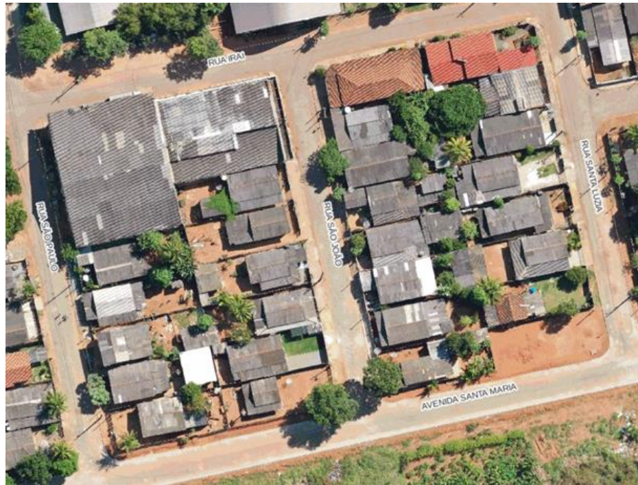
Figura 05 - Habitar Brasil

Cnpj: 01.310.499/0001-04 - Email: gabinete@claudia.mt.gov.br Av. Gaspar Dutra, s/n - Cep: 78540-000 - Fone: (0xx66) 3546-3100 - Cláudia/MT