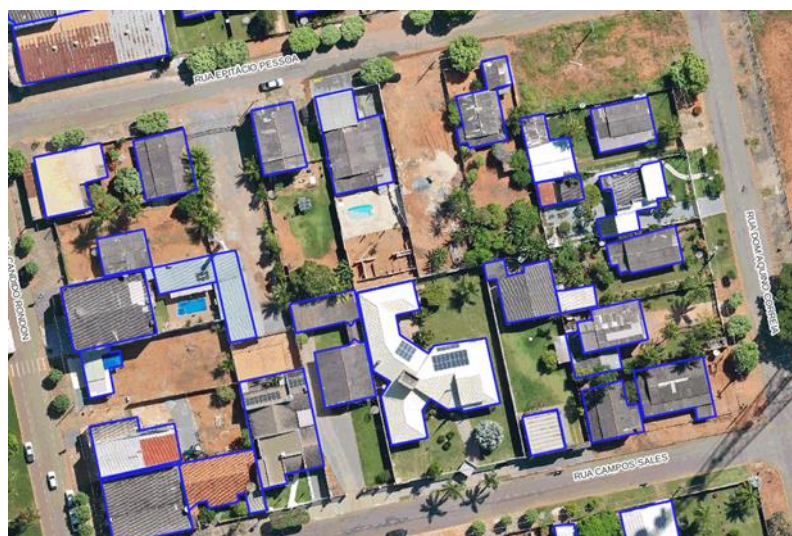
Figura 04 - Centro